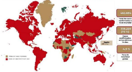
Distribución global de casos confirmados de COVID-19 por SARS-CoV-2 por laboratorio al día 26 de marzo de 2020.